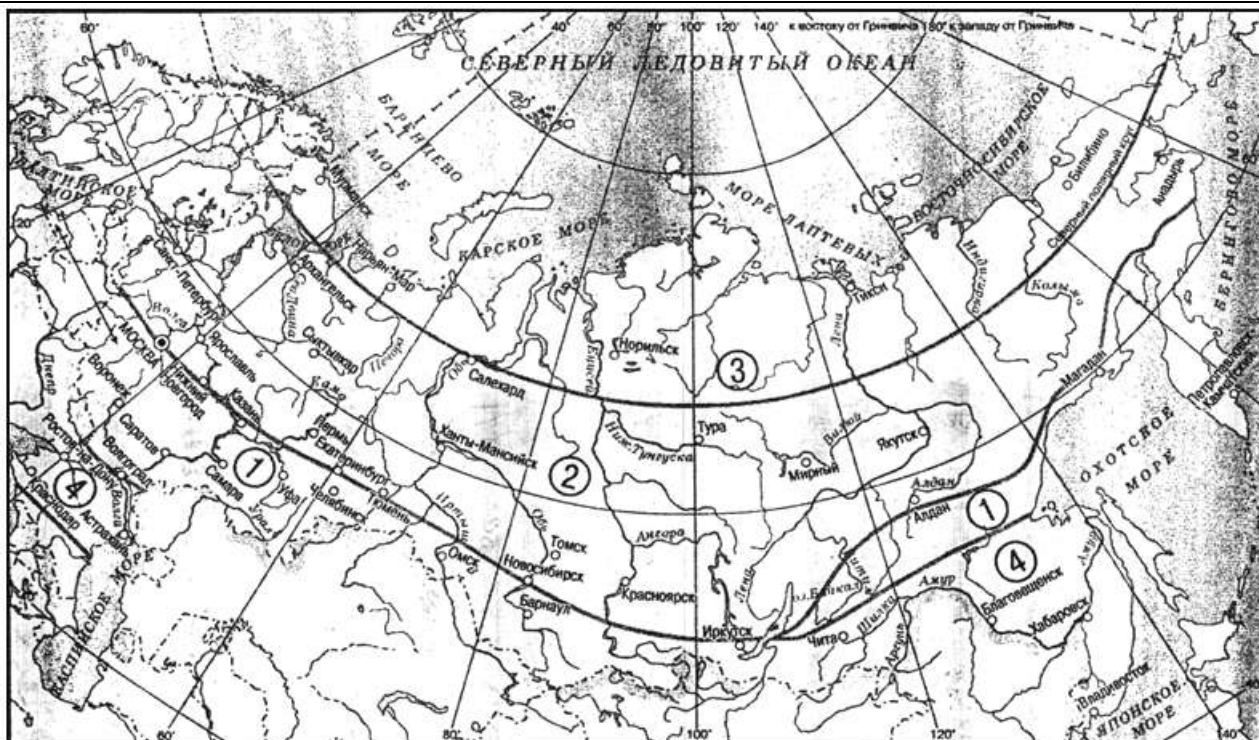
Рисунок В.1 - Классификация районов Российской Федерации в зависимости от климатических условий

Район 1 - северная граница: Великие Луки, Москва, Нижний Новгород, Казань, Екатеринбург, Тюмень, Новосибирск, южная часть Байкала, район Яблонового и Станового хребтов, побережье Охотского моря, Камчатка; южная граница: южная часть Урала, Саяны, Алтай, хребт Хамар-Дабан.